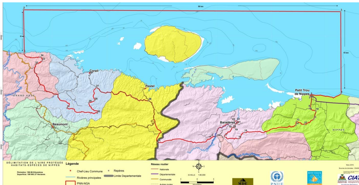
FIGURE 2: CARTE DU PARC NATIONAL DES BARADERES (DOCUMENT DE TRAVAIL DU CIAT).