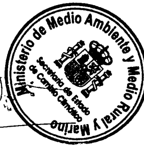
Fdo: Teresa Ribera Rodríguez Presidenta de la Autoridad Nacional Designada