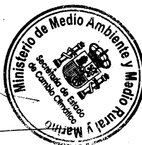
Fdo: Teresa Ribera Rodríguez Presidenta de la Autoridad Nacional Designada