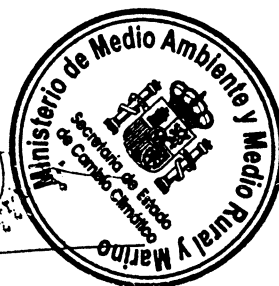
Fdo: Teresa Ribera Rodríguez Presidenta de la Autoridad Nacional Designada