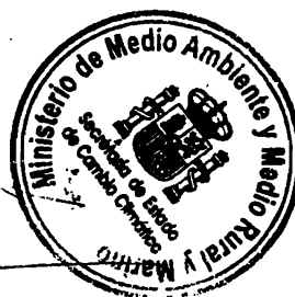
Fdo: Teresa Ribera Rodríguez Presidenta de la Autoridad Nacional Designada